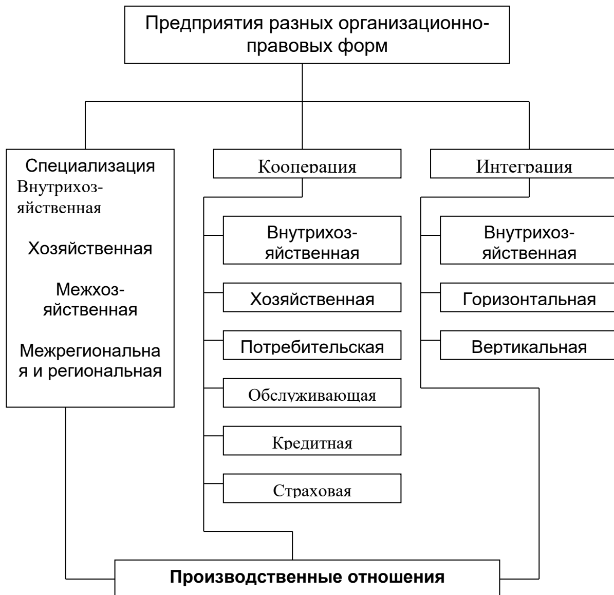
Рис. 2. Схема взаимосвязи специализации, кооперации и интеграции в условиях многоукладной экономики.

равенство всех форм и видов хозяйствования на селе. Развитие сельскохозяйственного производства в основном шло по трем основным направлениям. Наиболее распространенным из них является поддержка государством семейных фермерских хозяйств. Второе направление - формирование кооперативов, третье - создание крупных аграрных предприятий.