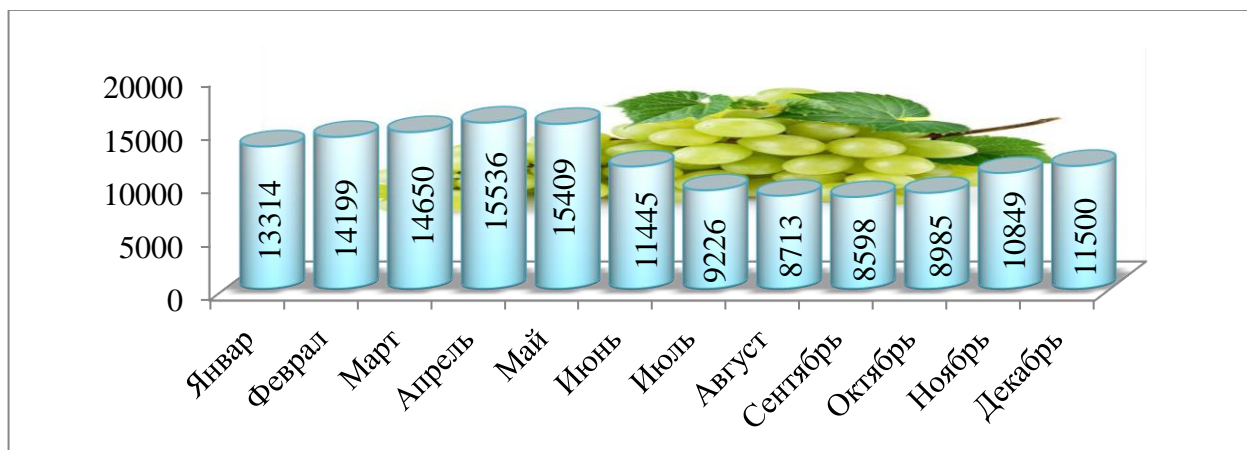
2-расм. 2020 йилда ойлар кесимида узум баҳосининг ўзгариш динамикаси, сўмда 2

Хусусан узум баҳосининг йил давомида ойлар кесимида тебраниш динамикасига эътибор қаратадиган бўлсак, январ ойида шаклланган бозор баҳосига нисбатан 3 чоракда 30-40 фоизгача тебранганлигини кузатишимиз мумкин (1-расм).