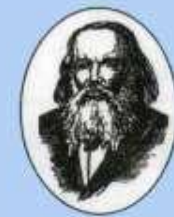
Д.И. Менделеев 1834–1907