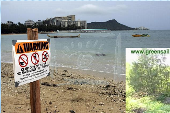
N007-2928 Противные дожди в городе Гонолулу (Honolulu) затопили канализационную систему, что способствовало загрязнению воды. На фото: пляж Вайкики (Waikiki Beach), Гавайские острова, 29 марта 2006.