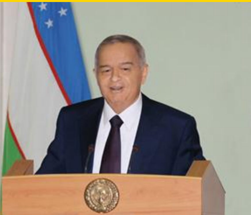
Ўзбекистон Республикаси Президенти И.А.Каримов

“Бизнинг асосий бойлигимиз, ривожлан- ган давлат тузулишига олиб борадиган йўлдаги асосий таянчимиз инсондир. Юксак малакали ва юксак маънавиятли инсондир”