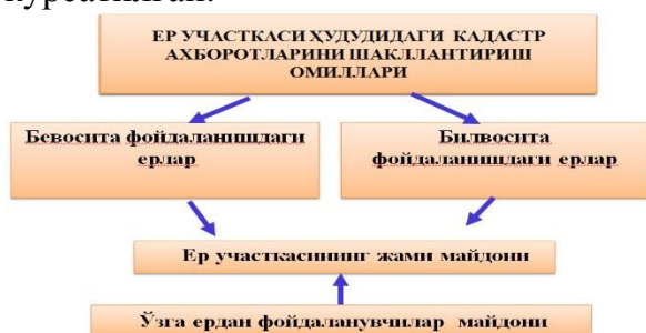
1-расм. Ер участкаси ҳудудидаги кадастр ахборотларини шакллантириш омиллари

Қуйидаги 1-расмда ер участкасидаги бевосита ва билвосита фойдаланишдаги ер турлари ҳамда ўзга ердан фойдаланувчилар тизими кўрсатилган.