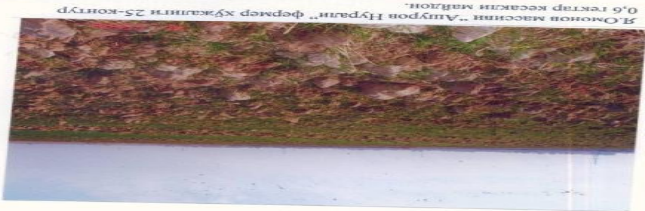
Я.Омонов массиви “Ашуров Нурали” фермер хўжалиги 25-контур 0,6 гектар кесакли майдон.