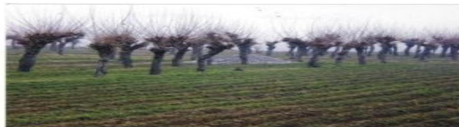
Жомбой тумани “Дустлик” ММТП Бердикул ота ф.х 0,8 га тутзор ноқонуний уй-жойга берилган