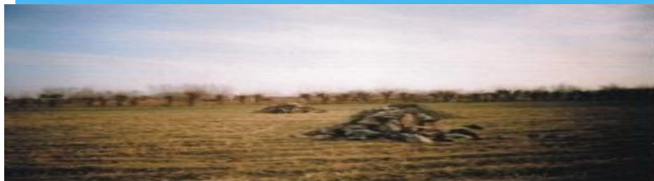
Пахтачи тумани Ш.Қаххаров ММТП Бахтиёр тонг ф.х 0,4 га сувли ер ноқонуний уй-жойга берилган

Самарқанд вилояти Пахтачи тумани Ш.Қаххаров ММТП худудида жойлашган “Бахтиёр тонг” фермер хўжалигига қарашли 0,4 гектар сувли ер майдони ноқонуний равишда уй-жой қуришга берилган