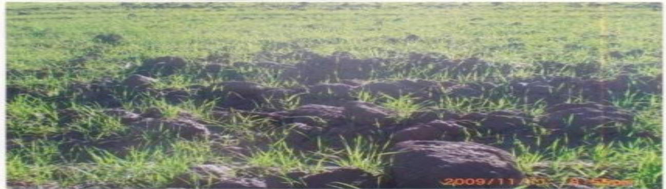
Ш.Умаров номли массив «Гулранг Дурмон» фермер хўжалиги 1,2 гектар кесакли.