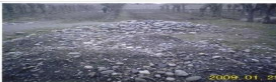
Тайлок тумани “Богизагон” ММТП Эсон Туйчи ф.х 0,2 га сувли ер ноқонуний эгаллаб олинган