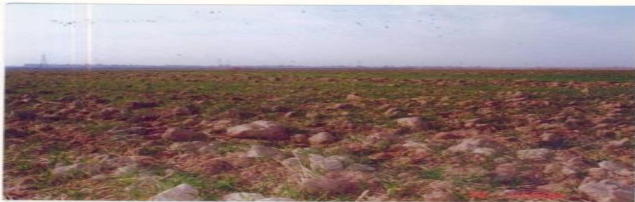
Я.Омонов массиви "Ашуров Нурали" фермер хўжалиги 25-контур 0,6 гектар кесакли майдон.

Қашқадарё вилояти Қарши тумани Я.Омонов номли массивидаги Ашуров Нурали номли фермер хўжалиги харитасида 25-контурдаги 0,6 гектар кесакли майдонга экилган галла