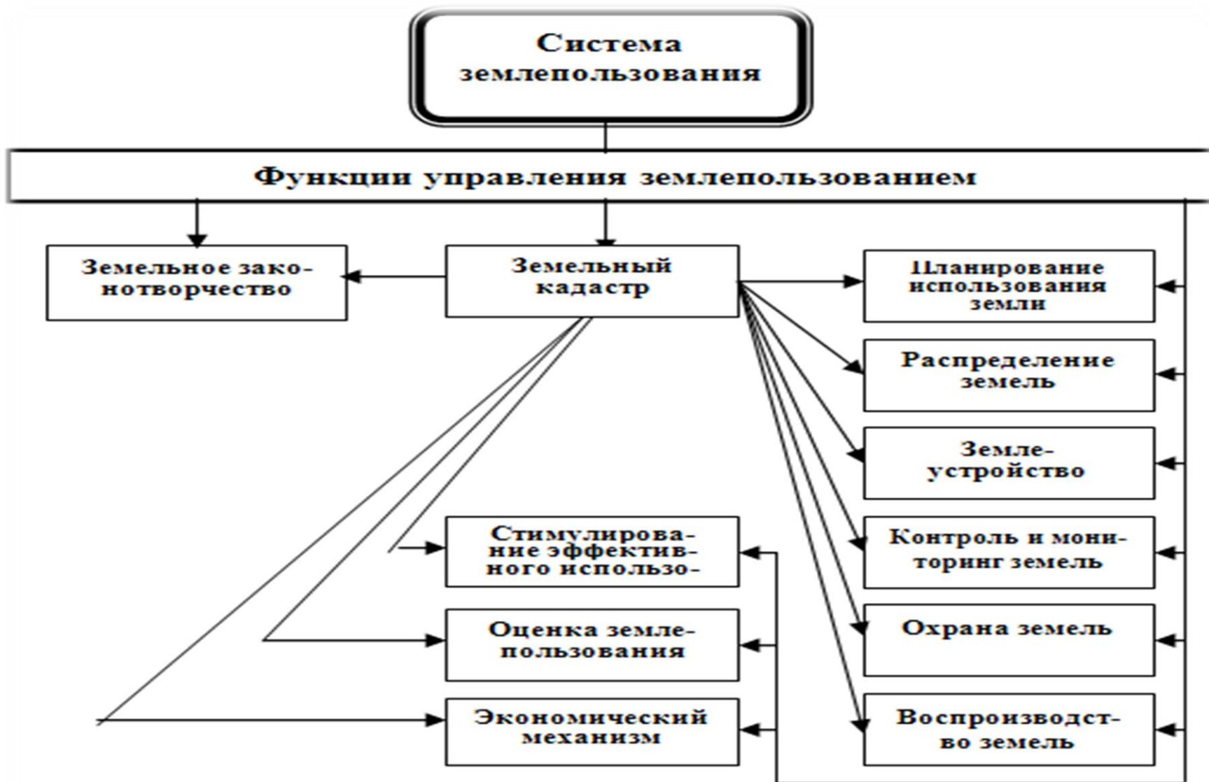
Рис.1. Роль земельного кадастра в информационном обеспечении функций землепользования.