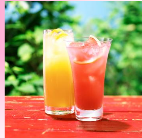
Two glasses of juice