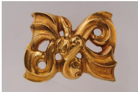
Cover plate of a belt in the form of a deer head Issyk mound. Zhetysu. IV-III cc. BC. Gold

The beginning of the formation of the image of a bird-horse, horse-ibex are observed in an initial period of the ancient nomadic epoch. One of the markers for