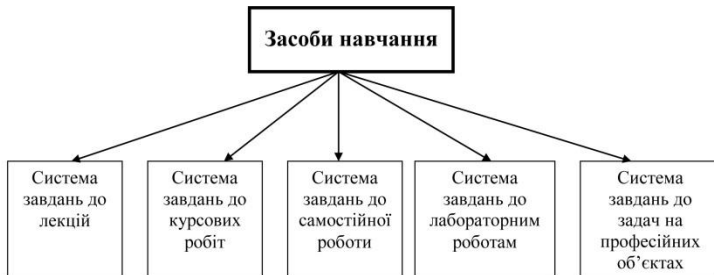
Рис 2. Засоби навчання фізики

Треба відмітити, що центральним стержнем методичної системи є викладання і навчання, тобто діяльність викладача і діяльність студента, які здійснюються у відповідності з метою освіти і навчання. Для організації процесу навчання фізики, мета якого визначається формуванням системи фізичних знань, необхідно визначити дидактичні і психолого-педагогічні умови.