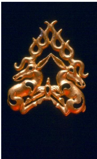
Plaque in the form of deer with the bent legs Zhalauly. Zhetyssu. VI-V cc. BC. Gold

The images of deer with the bent legs dated to the Scythian period are not known in the Eurasian steppes. The findings from Shilikty (East Kazakhstan) are similar to the Minusinsk artifacts, just by the features that distinguish them from the Black Sea region: the last appendix is directed upwards, but do not form the loops; S-shaped horns are obliquely located, and not vertically, the shape of the ear is closer to the Minusinian than to the Black Sea region.