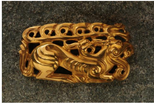
Cover plate of a belt in the form of a lying deer Issyk mound. Zhetysu IV-III cc. BC. Gold

According to the artistic and stylistic features, the golden deer from Issyk barrow is a transitional link connecting Middle Eastern and Siberian patterns, although, in general, it is unique, individual and original. It differs from all known Scythian deer of Eurasia by the complexity and stylization of the plot, a deep completeness of the forms and a high technique of execution. As well as, the plot of standing deer, goat and argali with the bent legs in the so-called "before jumping" position is widespread. A lot of of them adorn various pommels found in Siberia, in Ordos (Central Asia), in the Black Sea region, and dated to VI-V centuries BC. The goats in "before jumping" position were discovered during excavations in the Eastern Pamirs, in Central and Northern Kazakhstan, and they are dated to the VI-V centuries BC [4].