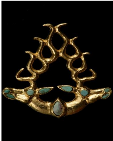
Pendant in the form of two heraldic combined heads of deer Shilikty mound. East Kazakhstan. VII-VI cc. BC. Gold, turquoise

The original masterpiece of the ancient nomadic art is a "deer" plaque containing a heraldic composition of two deer figures turned to the opposite directions, represented by the protomas, connected with each other by powerful crowns of massive branchy horns and thin elegant necks. The item is made using polychrome technology: eyes, ears, nostrils, mouths are encrusted with turquoise.