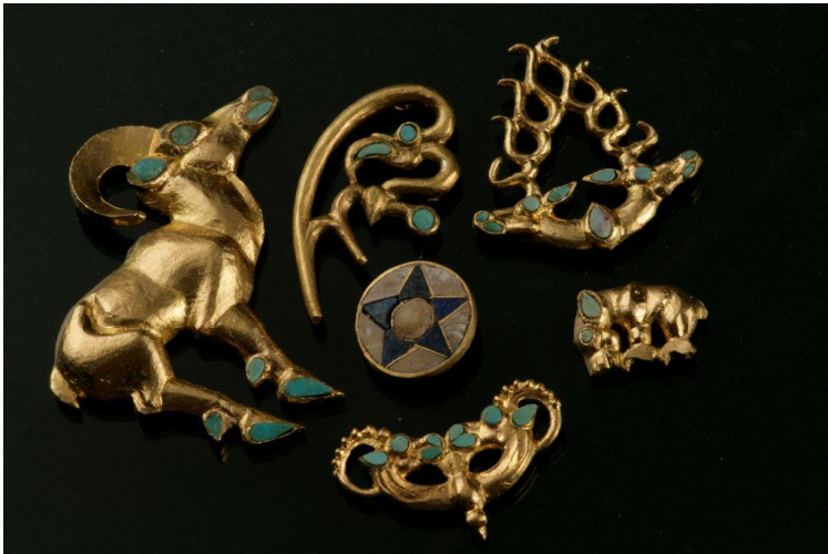
Golden findings, made in an animal style Shilikty mound. East Kazakhstan. VII-VI cc. BC

One of the main plots of images in a peculiar art of the early nomads were deer, inhabited in the vast spaces of Eurasia. The stylized images of strong and fast animals in certain poses, made using specific techniques are characteristic of the Scythian-Siberian animal style. As a rule, the animal style was used in the design of clothing, household items, weapons and horse caparison.