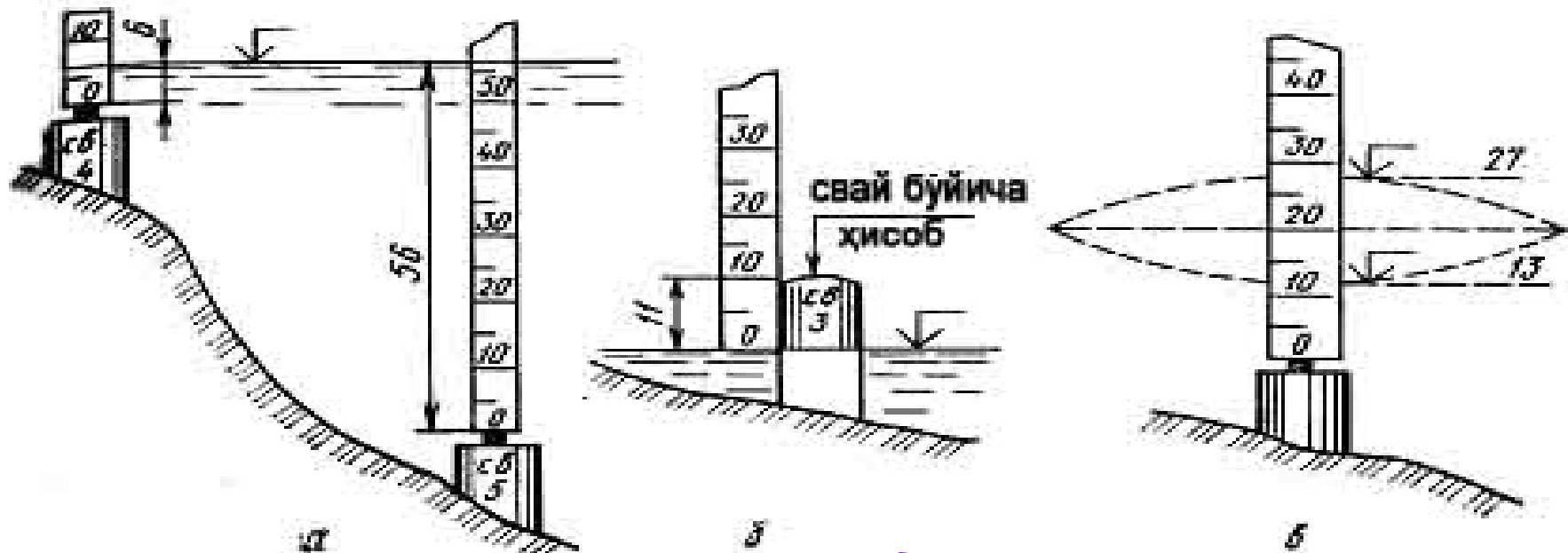
1 – расм Сув ўлчаш постларида сув сатҳини ўлчаш вариантлари:

а – икки свай бўйича; б – кузатиш нулидан пастда жойлашган сув сатҳи бўлганда; в – эркин сатҳда тўлқинланиш бўлган шароитда. Ўлчамлари см. да.