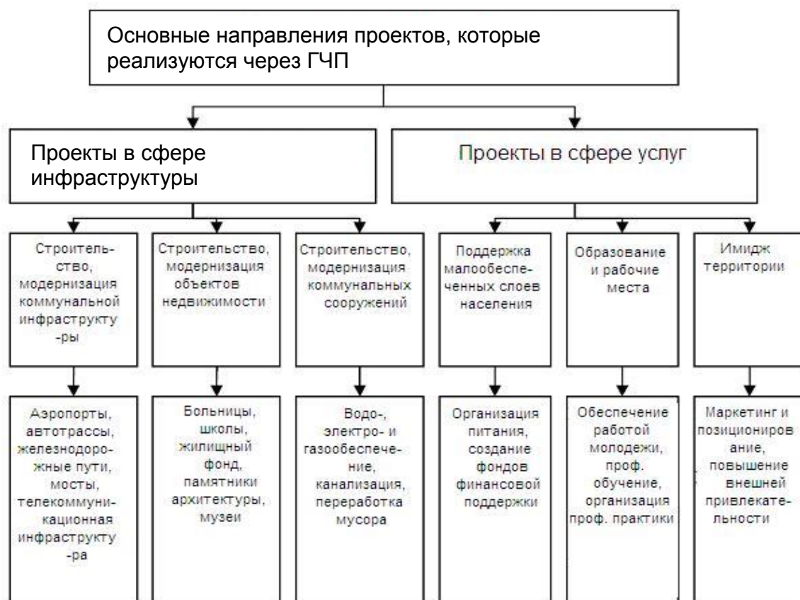
Рисунок 1. Основные направления проектов, которые реализуются через ГЧП (источник – составлен автором)

На рисунке 2 изображена принципиальная схема государственно-частного партнерства при реализации инфраструктурных проектов.