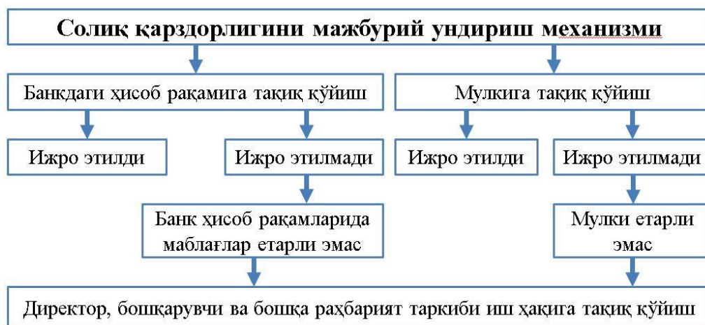
2-расм. АҚШда солиқ қарздорлигини мажбурий ундириш механизми [19]

АҚШда солиқ қарздорлигини мажбурий ундириш механизмининг самарали жиҳати шундаки, корхона ва ташкилотларнинг солиқ қарзлари охир оқибат, уларнинг директор, бошқарув ва бошқа раҳбарияти таркиби иш ҳақиға тақиқ қўйилишидадир.