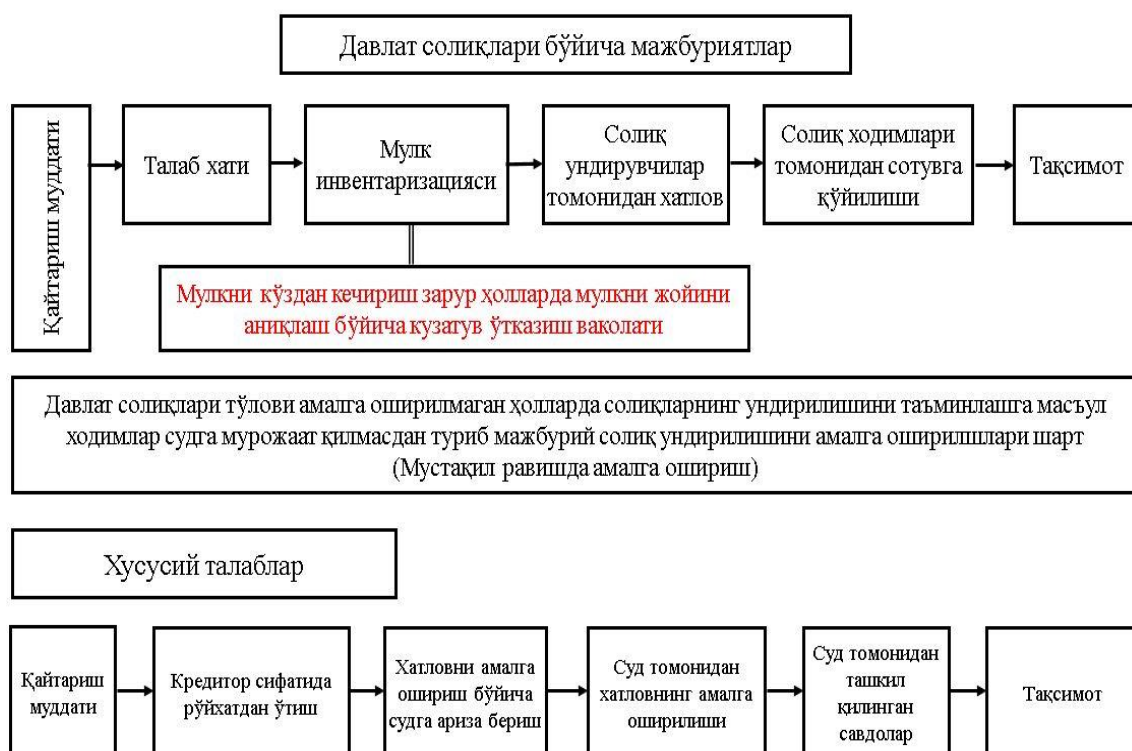
1-расм. Японияда солиқ қарздорлигини мажбурий ундириш механизми [18]

Бу борадаги илғор хориж тажрибасини ўрганар эканмиз, Японияда солиқ тўловчи қонун билан белгиланган муддатдан кечикиб солиқ тўловини амалга оширганда дастлабки кечиктирилган икки ой учун 4,5 % йиллик миқдорда (фоиз ставкалари банкнинг қайта молиялаштириш ставкасидан келиб чиқиб ҳар йили ўзгартирилади), иккинчи ойдан ошган қисмига 14,6 % йиллик фоиз миқдорда молиявий чоралар қўрилади (1-расм).