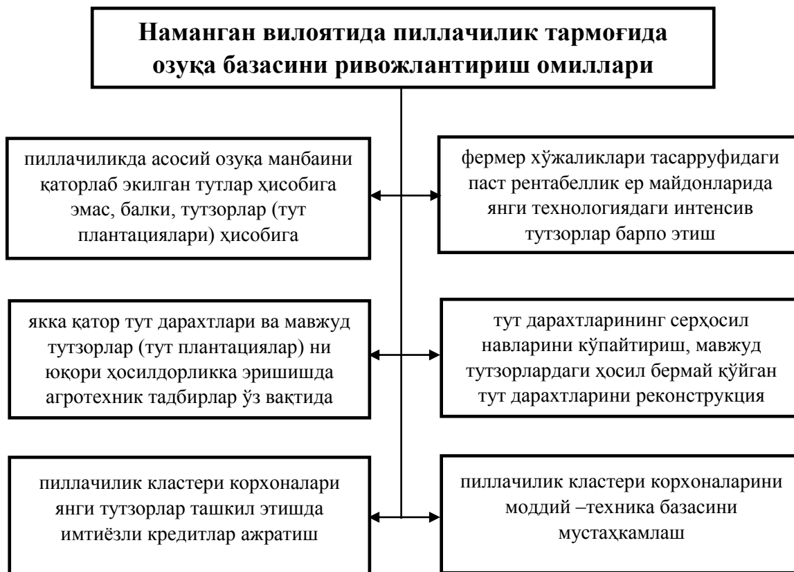
3-расм. Наманган вилоятида пиллачилик тармоғида озуқа базасини ривожлантириш омиллари

102,7 минг дона, (88,5 %) , Поп туманида 131 минг ўрнига ҳақиқатда 85,1 минг дона (65,0%), Чортоқ туманида 97 минг ўрнига ҳақиқатда 94,0 минг дона (96,9 %), Чуст туманида 122 минг ўрнига ҳақиқатда 98,0 минг дона (80,3%), Янгиқўрғон туманида 115 минг ўрнига ҳақиқатда 93,0 минг дона (80,7%)ни ташкил қилди.