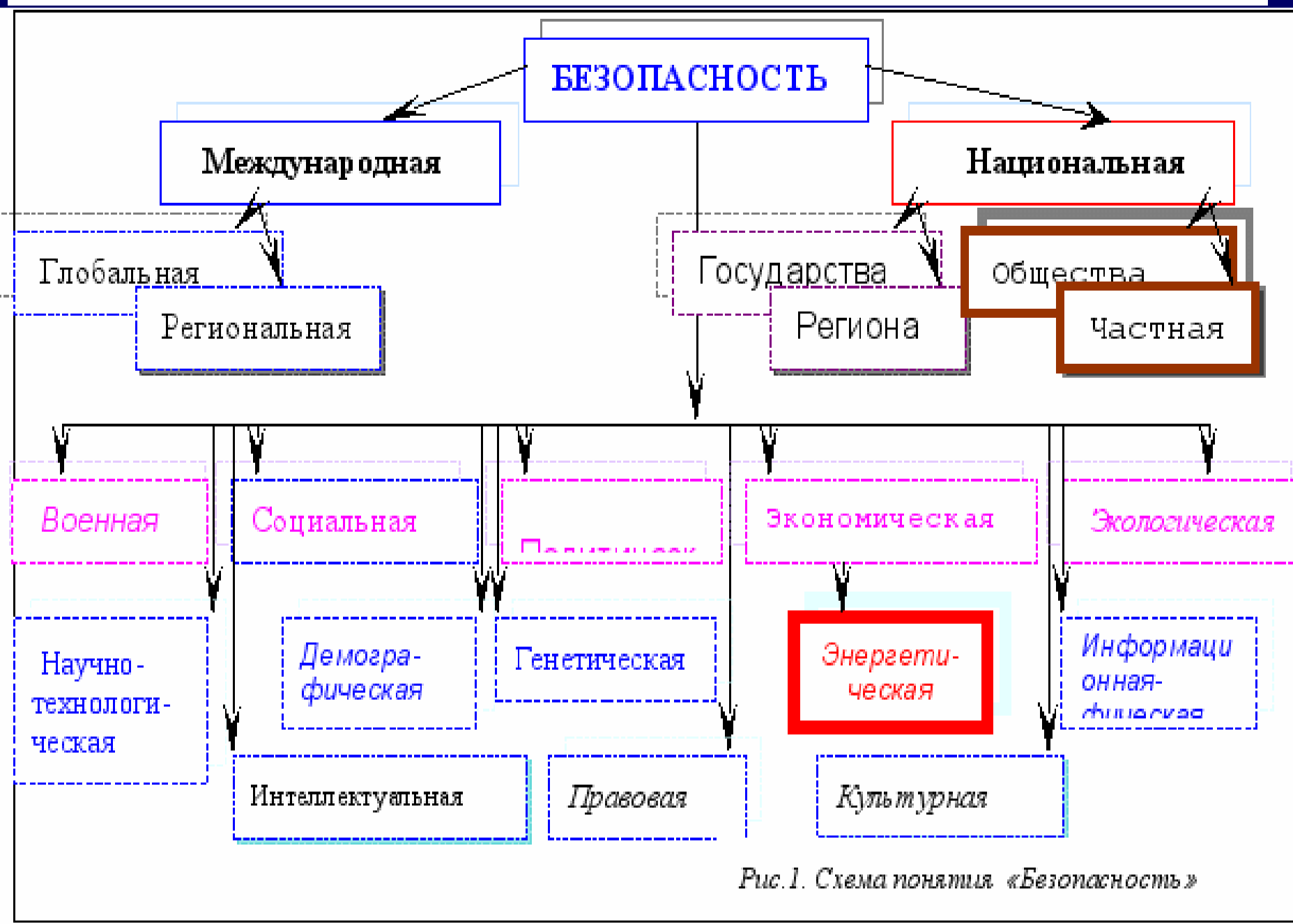
Рис.1. Схема понятия «Безопасность»