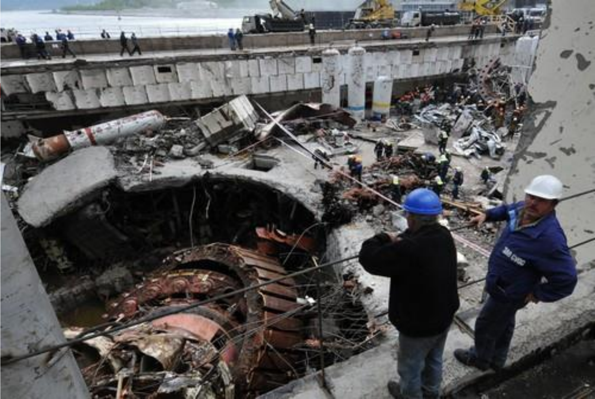
Авария на Саяно-Шушенской ГЭС