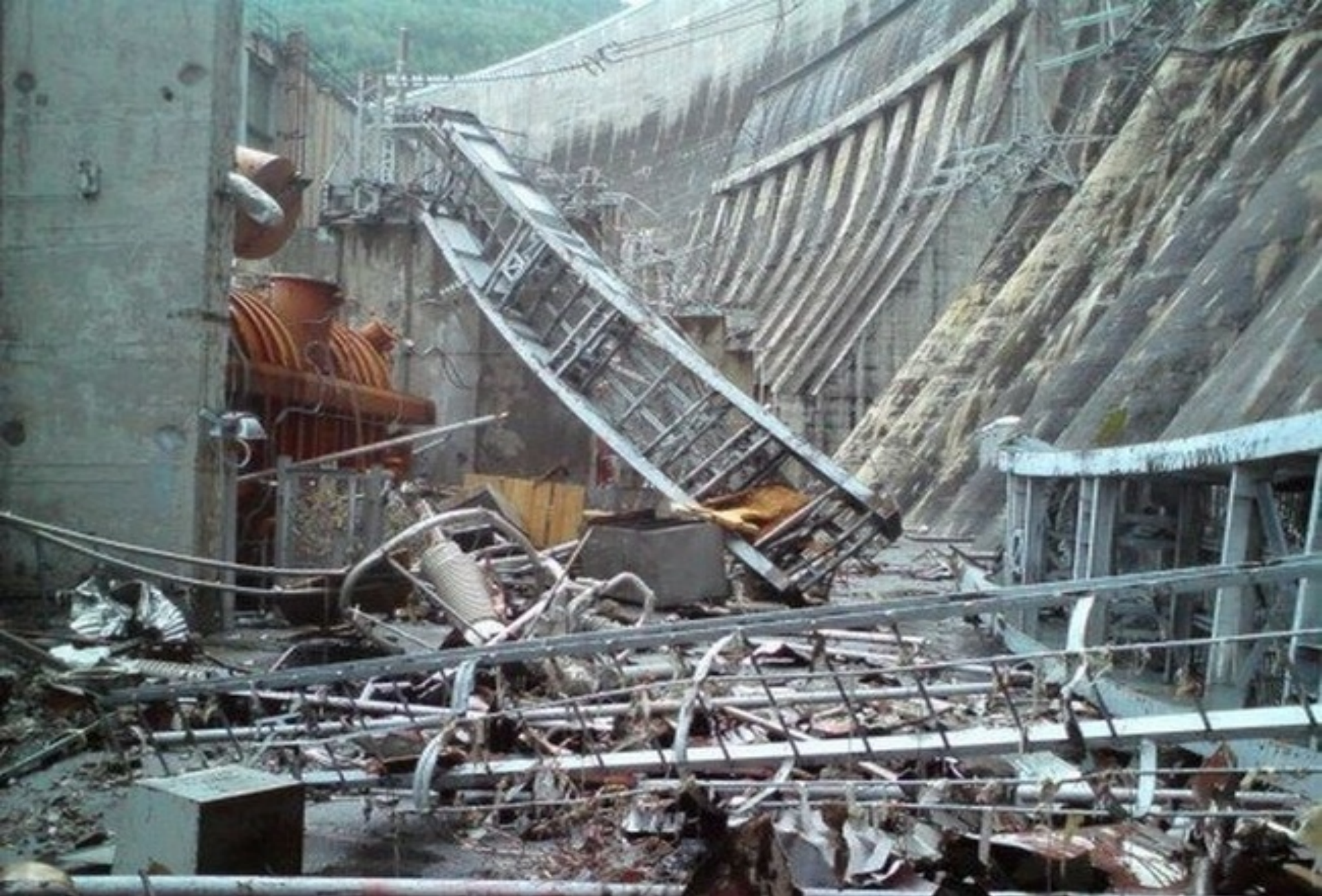
Авария на Саяно-Шушенской ГЭС