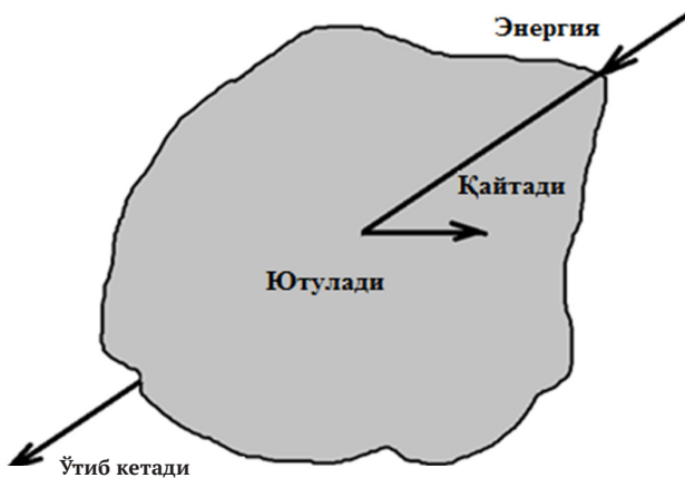
1-расм. Энергияни муҳитга таъсири

Электр ишлов беришда бажариладиган иш ютилган энергия ҳисобига бўлади. Шунинг учун ҳам технологик жараёнларга энергияни киритишда турли самарали усулларни қўллаш ва уларни тўғри танлаш муҳим босқичлардан бири ҳисобланади.