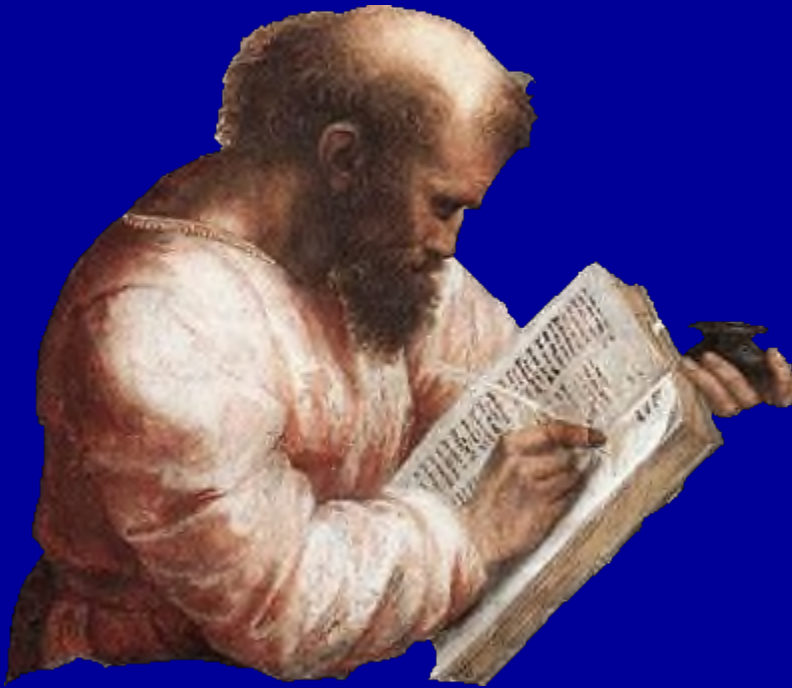
Пифагор (VI в. до н.э.)