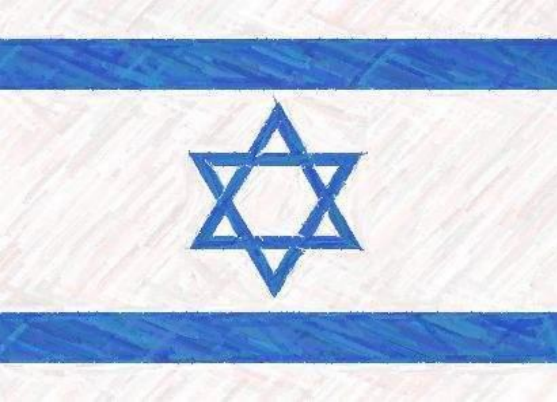
Флаг Государства Израиля