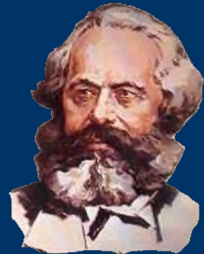
К. Маркс К критике политической экономики

В общественном производстве своей жизни люди вступают в определённые, необходимые, от их воли не зависящие отношения – производственные отношения , которые соответствуют определённой ступени развития их материальных производительных сил . Совокупность этих производственных отношений составляет экономическую структуру общества, реальный базис , на котором возвышается юридическая и политическая надстройка и которому соответствуют определённые формы общественного сознания .