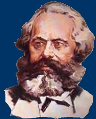
К. Маркс Восемнадцатое брюмера Луи Бонапарта

Люди сами делают свою историю, но они её делают не так, как им вздумается, при обстоятельствах, которые не сами они выбрали, а которые непосредственно имеются налицо, даны им и перешли от прошлого.