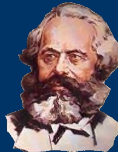
К. Маркс и Ф. Энгельс Немецкая идеология

Людей можно отличать от животных по сознанию, по религии – вообще по чему угодно. Сами они начинают отличать себя от животных, как только начинают производить необходимые им средства к жизни, – шаг, который обусловлен их телесной организацией. Производя необходимые им средства к жизни, люди косвенным образом производят и самую материальную жизнь.