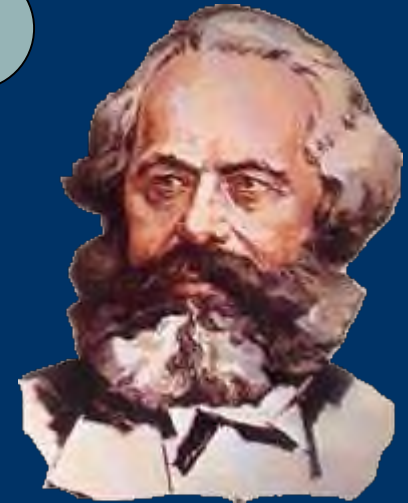
К. Маркс К критике политической экономики

На известной ступени своего развития материальные производительные силы общества приходят в противоречие с существующими производственными отношениями, или – что является только юридическим выражением последних – с отношениями собственности, внутри которых они до сих пор развивались. Из форм развития производительных сил эти отношения превращаются в их оковы. Тогда наступает эпоха социальной революции. С изменением экономической основы более или менее быстро происходит переворот во всей громадной надстройке.