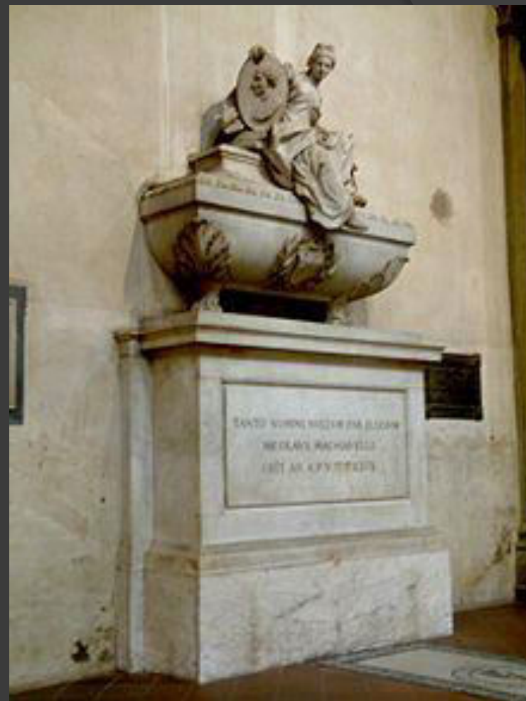
Надгробие Никколо Макиавелли