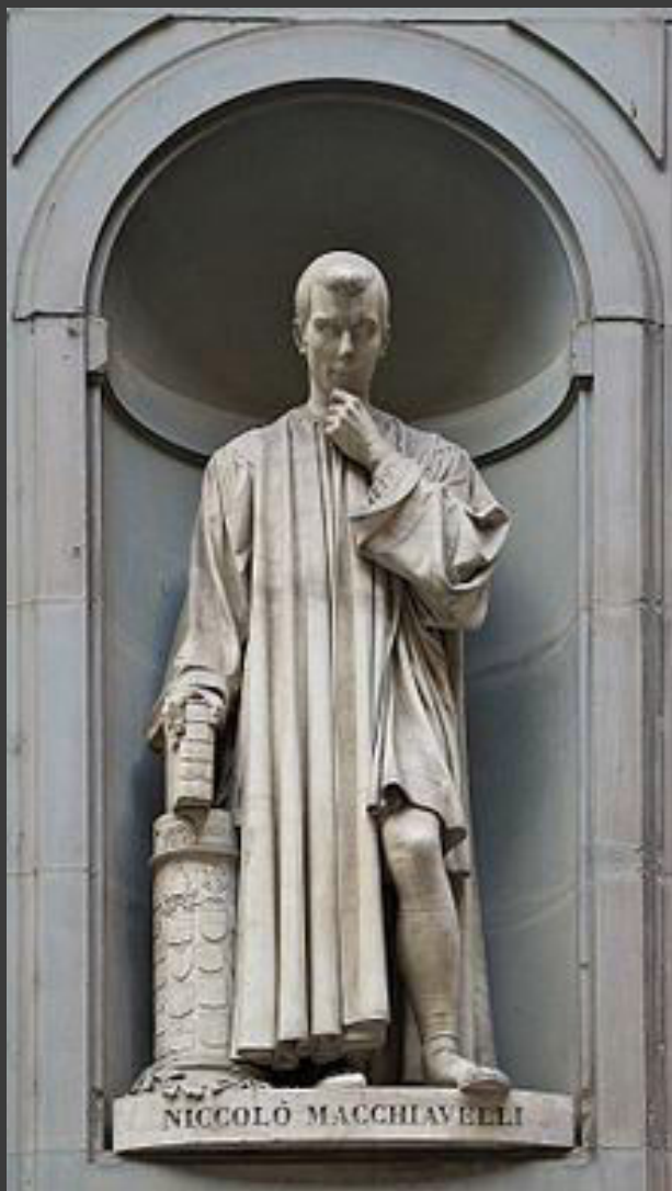
Статуя у входа в галерею Уффици во Флоренции