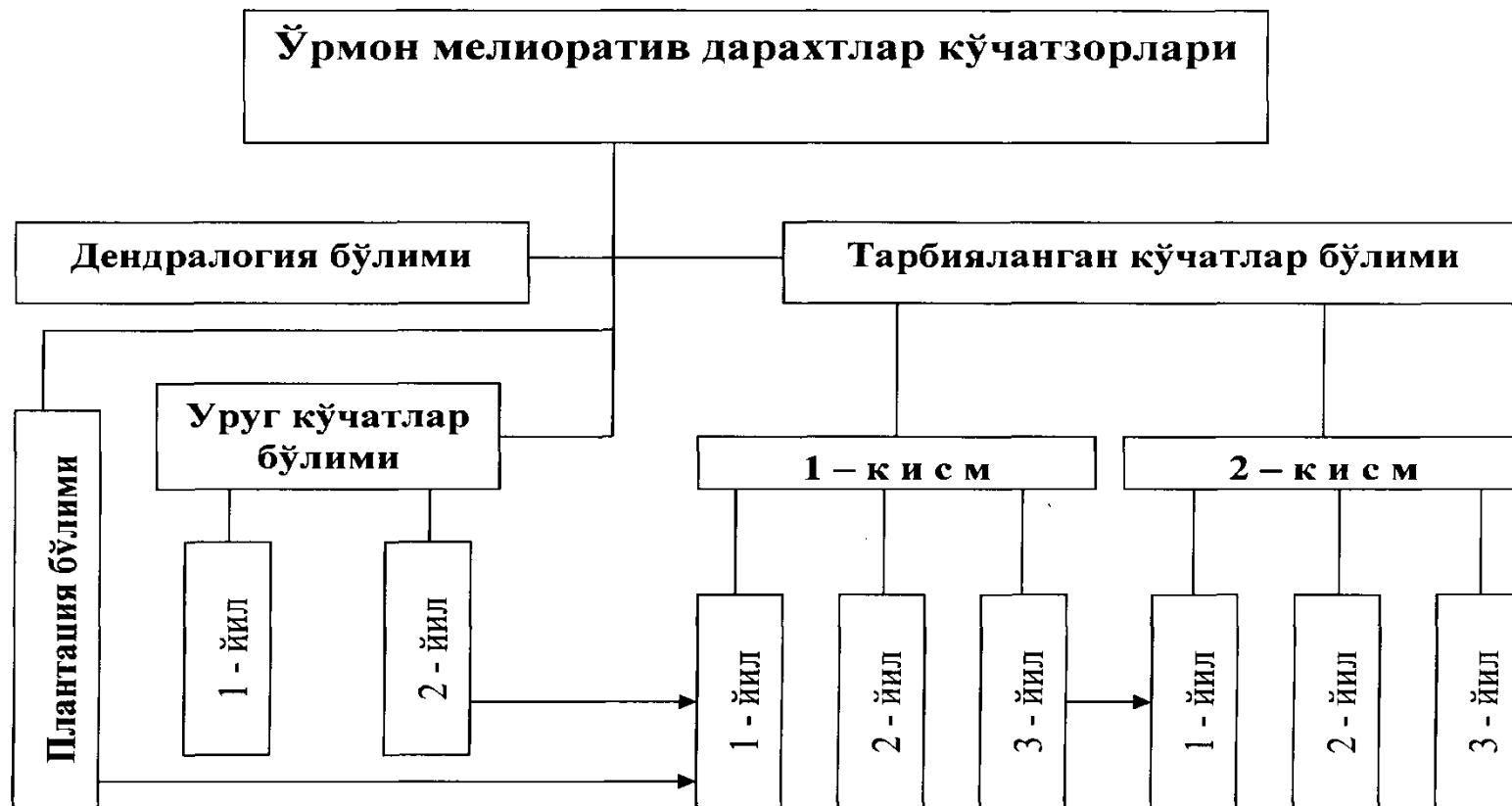
Расм-1. Мелиоратив ўрмон дарахтлари кўчатзорларининг таркибий қисмлари.

Мелиоратив ўрмон дарахтлари кўчатларини етиштиришга ихтисослашган йирик кўчатзорлар таркибида ишлаб чиқаришни илмий асосда ташкил қилиши учун қуйидагилардан иборат бўлинмалар бўлиши керак (расм-22):