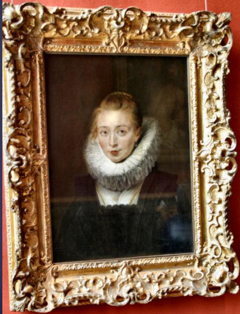
Portrait of a woman in a dark dress and white ruff collar, framed in an ornate, gilded frame.