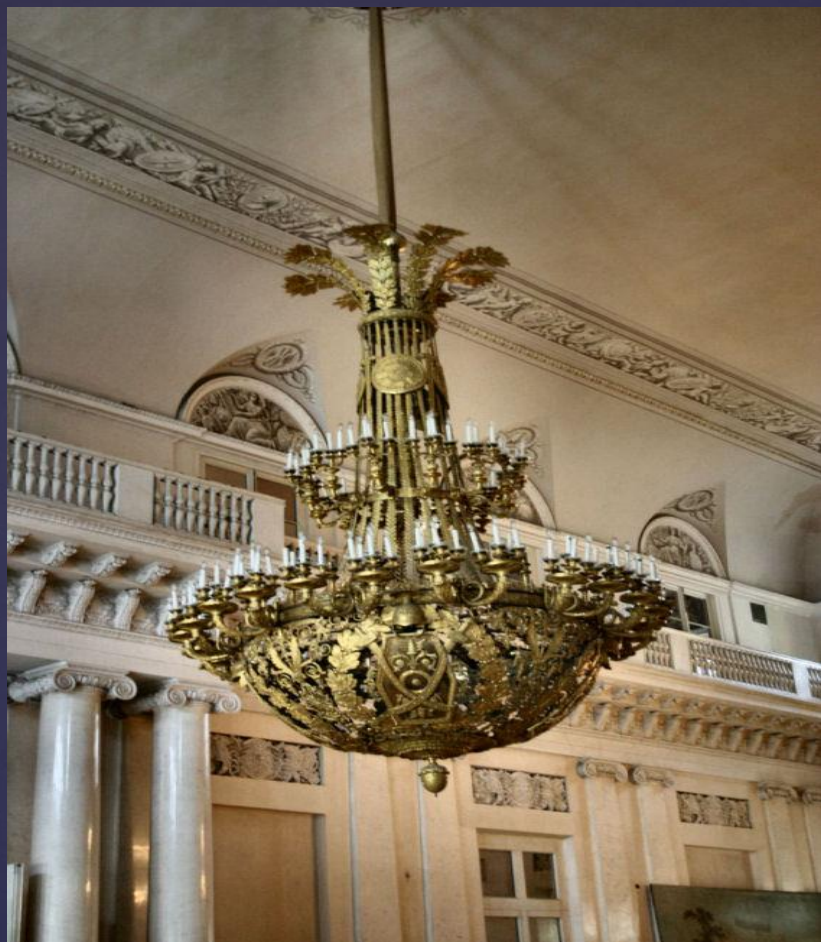
1- этаж Эрмитажа