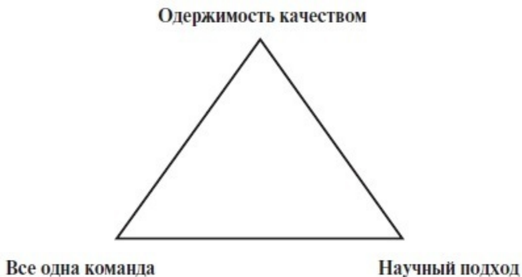
Рис. 2. «Треугольник Джойнера»

Научный подход простирается далеко за пределы простого манипулирования с числами, привнося идею одержимости качеством. Третья вершина в «Треугольнике Джойнера» называется «Все – одна команда». Командная работа, если она есть, дает много как делу, так и всей нашей жизни в целом: в семье, в социальной сфере, в спорте, и т. д.