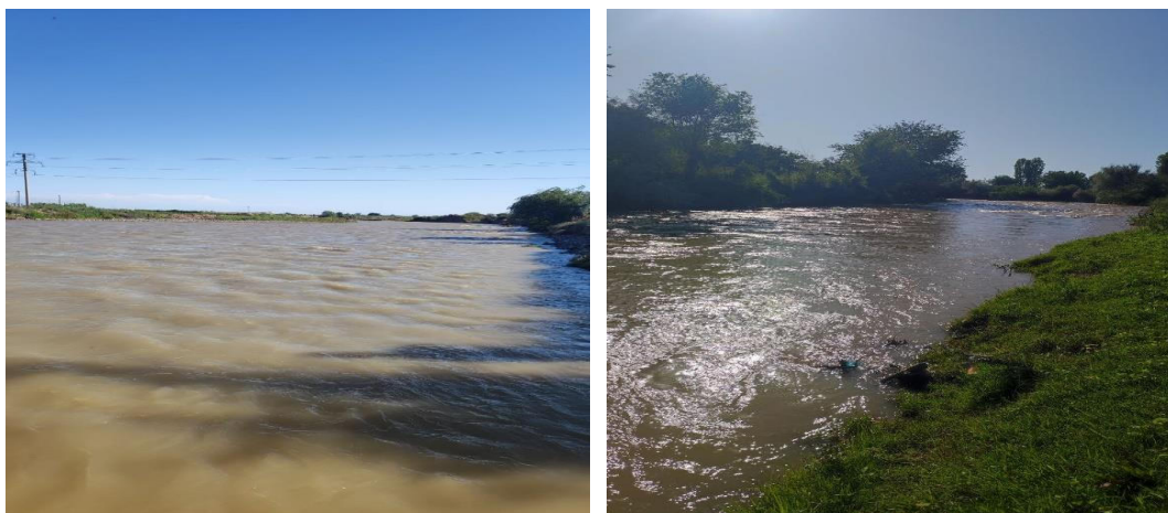
Рисунок 1. Участок РК 641+14 с Найманским гидроузлом на реке Карасув.

Со второй половины XX века влияние антропогенных факторов на сток рек в бассейне реки Карасув значительно усилилось. В этот период началось активное освоение новых земель, а также строительство крупных гидротехнических сооружений и каналов.