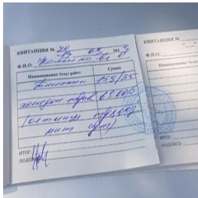
1-расм. Ягона ҳисоб-китоб марказига аъзо бўлмаган уй-жой мулкдорлари ширкатларида тўловларни қўлда ёзилган оддий тусдаги дафтари ва тўлов квитанцияси

Шуни таъкидлаш лозимки, бугунги амалиётда ширкат томонидан банкда ҳар бир мулкдор бўйича очилган шахсий ҳисоб варағи орқали электрон тарзда қиёсий таҳлил қилиш имконияти мавжуд эмас, ширкатда унга бириктирилган барча уйларнинг йиғиндиси бўйича тўланган умумий маблағлар бўйича маълумотлар мавжуд бўлса-да, ҳар бир мулкдор томонидан тўланган маблағлар ва унинг сарфланиши бўйича маълумотлар қайдномаси мавжуд эмас.