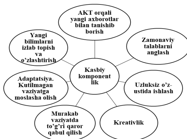
2-rasm. Kasbiy kompetentlik asoslari modeli.

Jadal rivojlanishda davom etayotgan taraqqiyot milliy ta'lim tizimiga va uning sifatiga tobora qat'iy mezon va talablarni o'rnatib kelmoqda. Zamon talablari bilan hamnafas holda qadam tashlab borish ko'p jihatdan AKT imkoniyatlaridan keng foydalanishni taqozo etmoqda. Elektron ta'limni rivojlantirish, bu boradagi eng muhim jihatlardan biri sanaladi. Zamonaviy axborotlashgan jamiyat pedagog kadrlar tayyorlash sifatiga alohida talablar qo'yadi. Zamonaviy pedagog kadrlardan INTERNETning axborot resurslaridan maqsadli foydalana olish, mustaqil bilimlarni olishlari jarayonida axborot va kommunikatsiya texnologiyalari vositalari imkoniyatlarini joriy etishi talab etiladi.