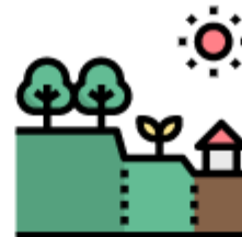
Land cover information