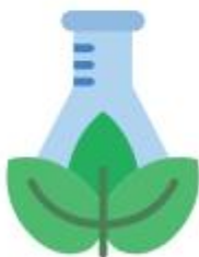
Environmental health monitoring