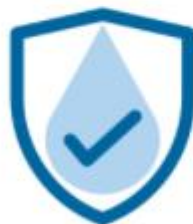
Water quality monitoring