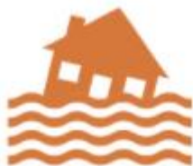
Flood monitoring & forecasting