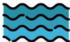
Hydrology & river monitoring