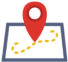
PNPCA project database