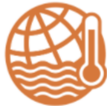
Climate change and adaptation