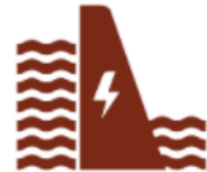
Hydropower legal documents