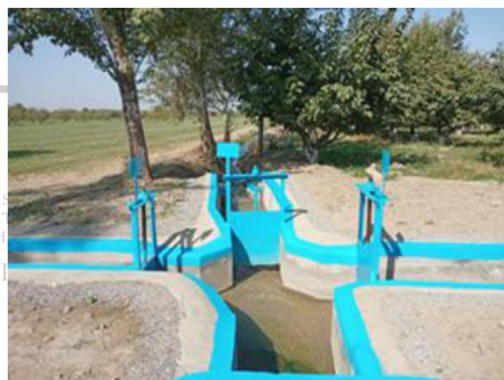
Ta‘mirlashdan keyingi holat

Qisqacha suv taqsimoti inshootiga izox berib ketsak. “Gilos” suv taqsimoti inshootining asosiy suv manbasi “Muxtor” kanali hisoblanadi. Suv taqsimoti inshootining suv ko‘tarish qobiliyati 550 l/sek bo‘lib xizmat qilish maydoni 80 gektar, 8 dona bog‘dorchilik va 1 dona fermer xo‘jalikka xizmat qiladi.