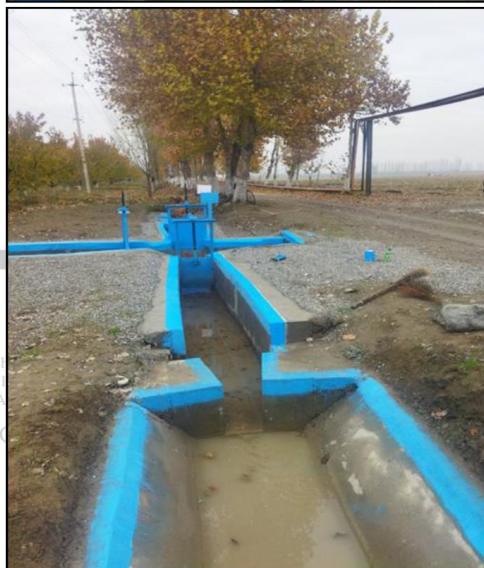
Ta'mirlashdan oldingi holat