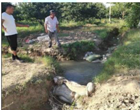
Ta‘mirlashdan oldingi holat

Tadqiqot natijalari: Suv taqsimoti inshooti qurilishi rejalashtirilgan joy qurilishdan oldin quyidagi muammolar kuzatilgan, jumladan 3 ta daxana bo‘yicha suvni taqsimlash, suv hisob-kitobi, quyi qismida joylashgan “Samo kuxna zamini” fermer xo‘jaligiga suvni yetib borishi, qishloq xo‘jalik ekinlari talabidan kelib chiqqan holda suvni yetkazib berish, suv taqsimoti vaqtida suvning ariqlar bo‘yicha suv sarfi aniq emasligi, suvni boshqarish qiyinligi, suv taqsimotida ishehi kuchining sarflanishi va suv taqsimoti joyida suv isrofining yuqoriligi metodik tomonidan o‘rganilganda kuzatildi. Quyida suv taqsimoti inshootining oldingi va ta‘mirlashdan keyingi holati keltirib o‘tilgan.