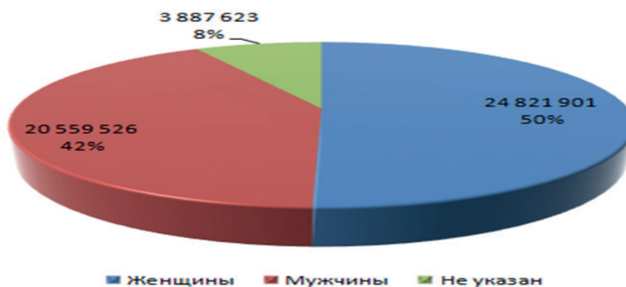
Рисунок 1. Соотношение женщин и мужчин в социальных сетях.

На сегодняшний день более 80% компаний по всему миру используют социальные сети в работе, около 78% людей доверяют информации из социальных сетей [1]. Каждый второй пользователь всемирной паутины зарегистрирован в какой-нибудь социальной сети. Теперь именно они центр современного интернета, а также центр притяжения для большого количества людей, особенно женщин, несмотря на то, что наблюдается более низкая заинтересованность представительниц женского пола в работе с информационно-коммуникативными технологиями. В ряде проводимых исследований отмечается, что для женщин интернет – это в основном общение и установление социальных связей, а структура деятельности мужчин более широка. Это различие получило название «гендерного разрыва» [2].