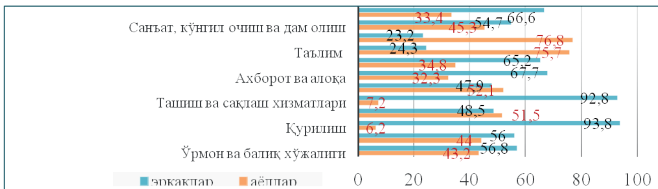
2-расм. Иқтисодий фаолият турлари бўйича бандлар улуши, % да (2020 йил)

Ўзбекистоннинг қишлоқ жойларида давлат ташкилотларидан ташқари, хусусий корхоналар жуда кўп эмас. Қишлоқ аёллари учун қишлоқ хўжалигидан ташқари ишнинг энг кенг тарқалган шакли бу маҳаллий истеъмолчиларга хизмат кўрсатиш. Меҳнат қишлоқ аёлларига маълум даражада мустақиллик беради, бу уларга оила бюджетига ўз хиссасини қўшишга имкон беради. Бундан ташқари, аёллар ўз даромадларини болалар таълими каби ҳаражатларга сарфлайдилар, бу эса болалар (айниқса қизлар учун ҳаёт имкониятларини кенгайтиради. Кўпинча, аёлларнинг қишлоқ хўжалигига оид бўлмаган тадбиркорлик фаолияти қишлоқ хўжалиги даромадларининг мавсумий хусусиятини уй хўжалиқларининг йиллик даромадларини барқарорлаштириш ҳисобига қоплайди. Бир қатор ижтимоий ва молиявий тўсиқлар қишлоқ аёлларининг тадбиркорлик ва иш билан таъминлаш имкониятларини чеклайди. Бунга қуйидаги муаммоларни киритишимиз мумкин: