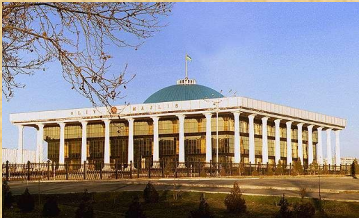
Олий Мажлис Қонунчилик палатаси