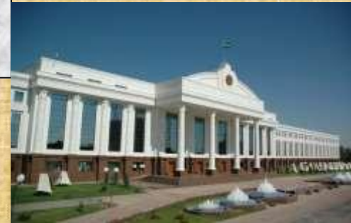
Олий Мажлис Сенати

Парламентнинг қуйи палатасига умумий депутатлар сонининг 22 фоизини ташкил этадиган 33 нафар хотин – қиз депутат этилиб сайланиш имконини берди.