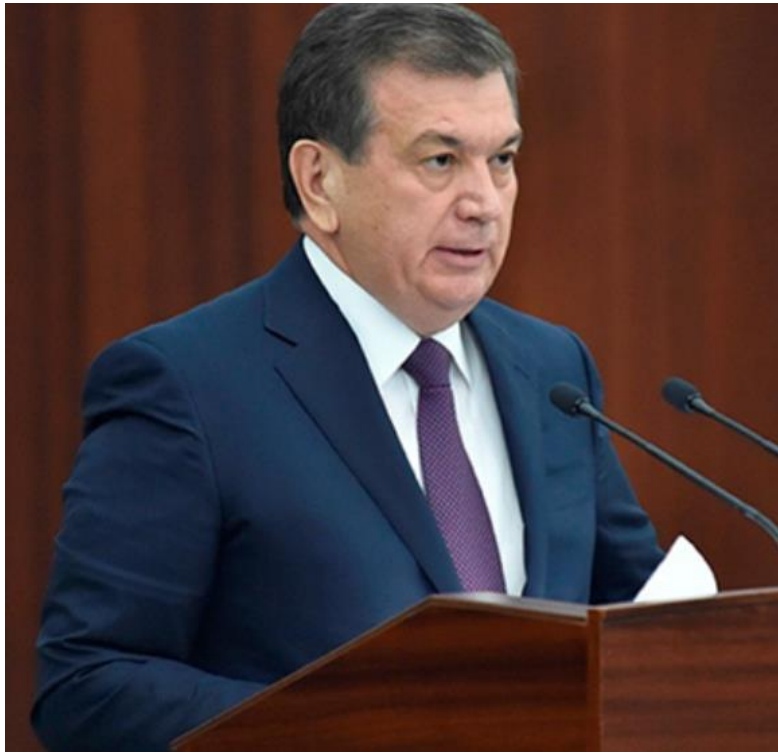
Ўзбекистон Республикаси Президенти