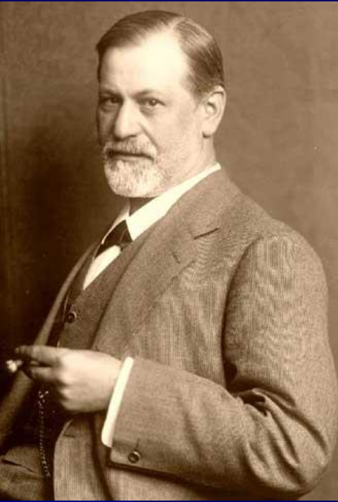
Sigmund Freyd (1856 – 1939)

Jinoyatning psixologik nazariyalari ham, biologik nazariyalar kabi jinoiy mayillarning shaxsning muayyan tipi bilan bog‘lanadi. Jinoyatni psixologik jihatdan talqin qilishga Freyd g‘oyalari, muayyan ta‘sir o‘tkazdi. Freyd fikriga ko‘ra, ilk bolalikda o‘rganiladigan o‘zini cheklashlardan ko‘pchilik axloqiy sifatlar vujudga keladi. Ota-onalar bilan o‘ziga xos munosabatlar shakllanishi oqibatida, ba‘zi bolalarda bunday cheklov shakllanmaydi va demak axloqiylik tuyg‘usi asosan mavjud bo‘lmaydi. Psixopatlarni zo‘rlikdan lazzat oladigan odamovi shaxslar sifatida tavsiflash mumkin.