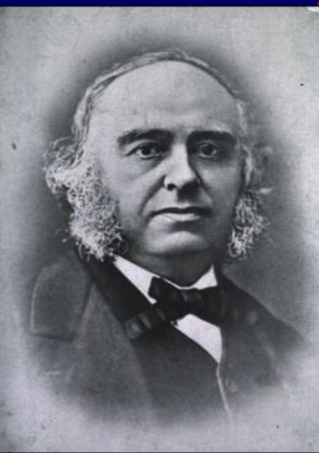
Pol Broka (1824 – 1880)