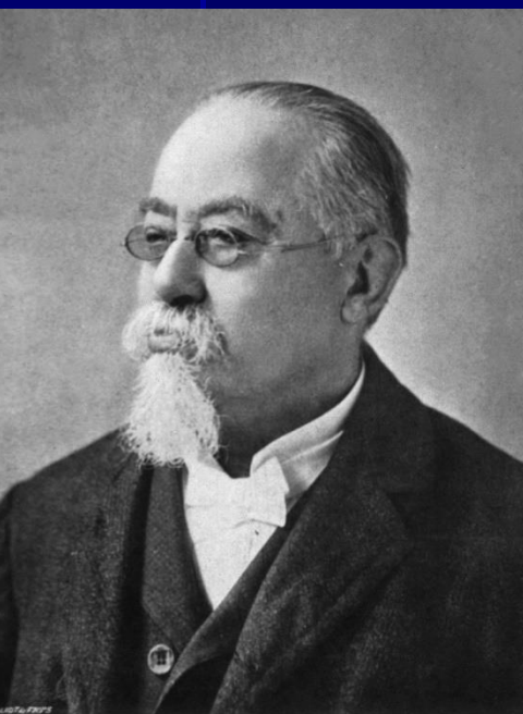
Cezare Lombrozo (1835 – 1905)