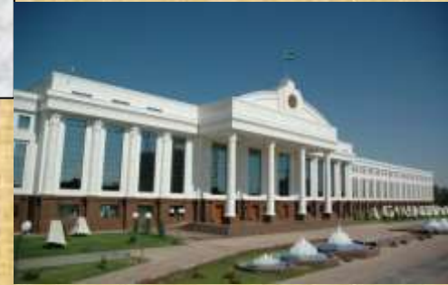
Олий Мажлис Сенати

Парламентнинг қуйи палатасига умумий депутатлар сонининг 22 фоизини ташкил этадиган 33 нафар хотин – қиз депутат этилиб сайланиш имконини берди.