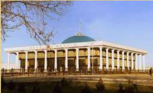
Олий Мажлис Қонунчилик палатаси