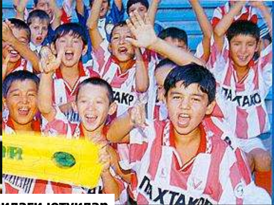
Спорт соҳаларидаги ютуқлар