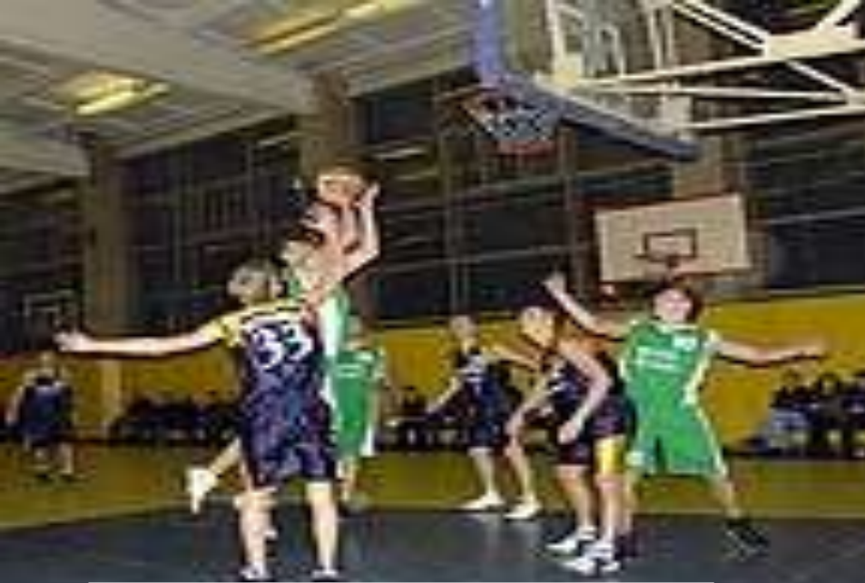
Спорт соҳаларидаги ютуқлар