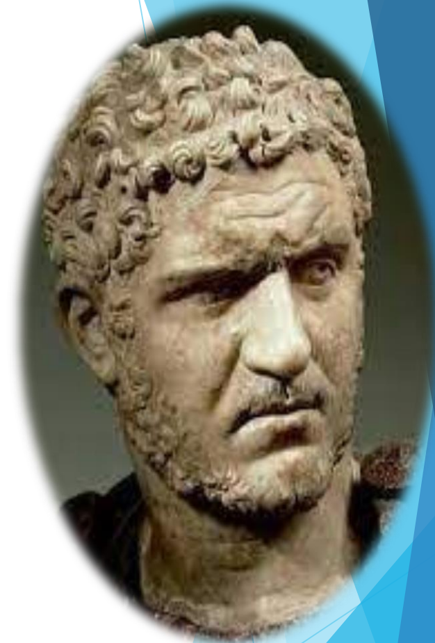
Lutsiy Anney Seneka

Senekaning fikricha, insonlarning mavjudligini, ijtimoiy mohiyatini belgilovchi birlamchi huquq ilohiyotdan belgilab berilgan «taqdir qonuni» hisoblanadi. Bu qonunda insonlarning huquq va erkinliklari tabiatan cheklanmagan bo'lib, uning chegarasini faqat quyoshning mangu harakati belgilashi mumkin. Lekin insonlar bunga qanoat qilmay bir-birlarining huquq va erkinlik-larini cheklovchi qonunlar yaratadilar va shu bilan o'zlarining ilohiyotdan tabiatan in'om etilgan huquqlaridan mahrum bo'ladi-lar deb baho beradi Seneka. Mutafakkir fikricha, bunday adolat-sizlikni faqat barchaning umumiy farovonligini ta'minlagan g'oyibdan bizga in'om etilgan buyuk davlat, Seneka ta'biri bilan aytganda, «katta davlat»gina bartaraf etishi mumkin.