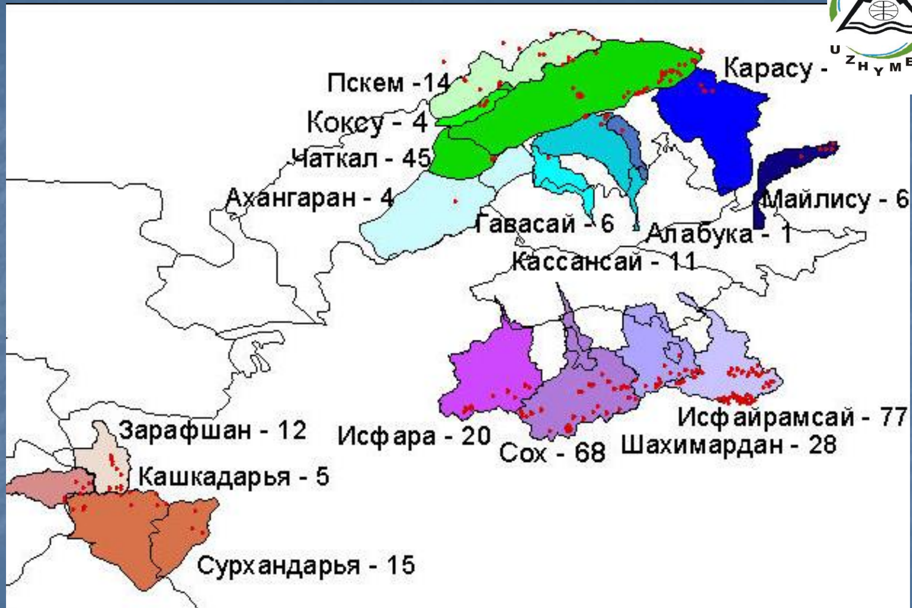
Ўрта Осиёда жойлашган баланд тоғ кўллари