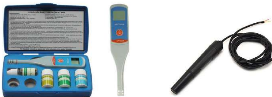
2-расм. а) QY-620 русумли рН – ўлчагичнинг умумий кўриниши б) Электр ўтказувчанлик датчиги

2-усул. Замоनावий рН ўлчагичи билан ҳам маълумотлар олинди. QY-620 русумли тестер микропроцессорга асосланган ва бириктирилган кўрсатмаларга мувофиқ қурилма ишлаб чиқарувчисининг дастурий таъминоти ёрдамида бошқарилади. QY-620 русумли рН – ўлчагичнинг умумий кўриниши 2-расмда келтирилган.