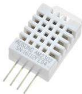
3-расм. Рақамли ҳарорат ва намлик датчики

Ҳароратни ва намлик тўғрисида бирламчи маълумотларни олиш учун ДХТ22 WAVEGAT АМ2302 русумли датчик қўлланилди. Датчикнинг умумий кўриниши 3-расмда келтирилган.