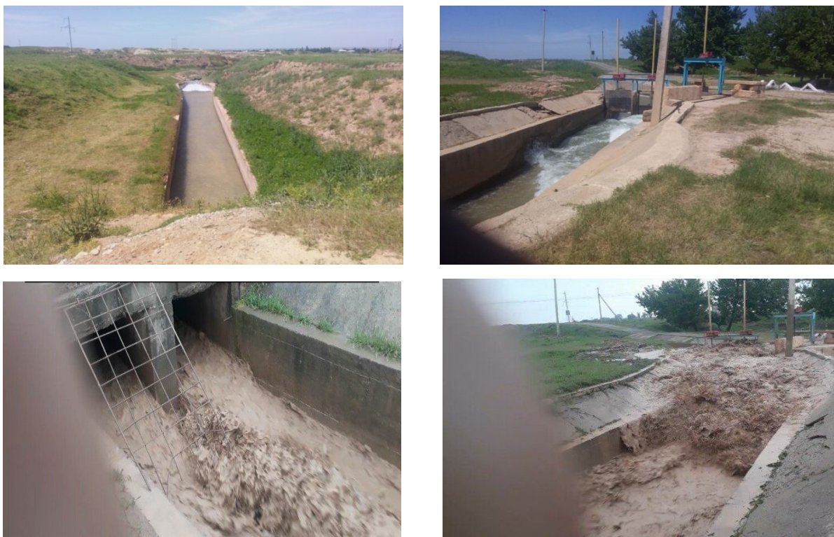
3-rasm. Langar selsuv omboridan sel-toshqinlarni o‘tkazishdan so‘ng suv chiqarish inshootidagi nosozliklar

Sel-toshqinlarga asosan jadallashgan yog‘ingarchilikning tasodifiy sodir bo‘lishi sabab bo‘lmoqda, natijada esa daryolarning doimiy oqimi sel oqimi bilan qo‘shilib tezkor va qisqa muddatda katta xavflar sodir etmoqda. Respublikamizda aksariyat katta sel-toshqinlar tog‘li va tog‘oldi hududlarida sodir bo‘lmoqda.