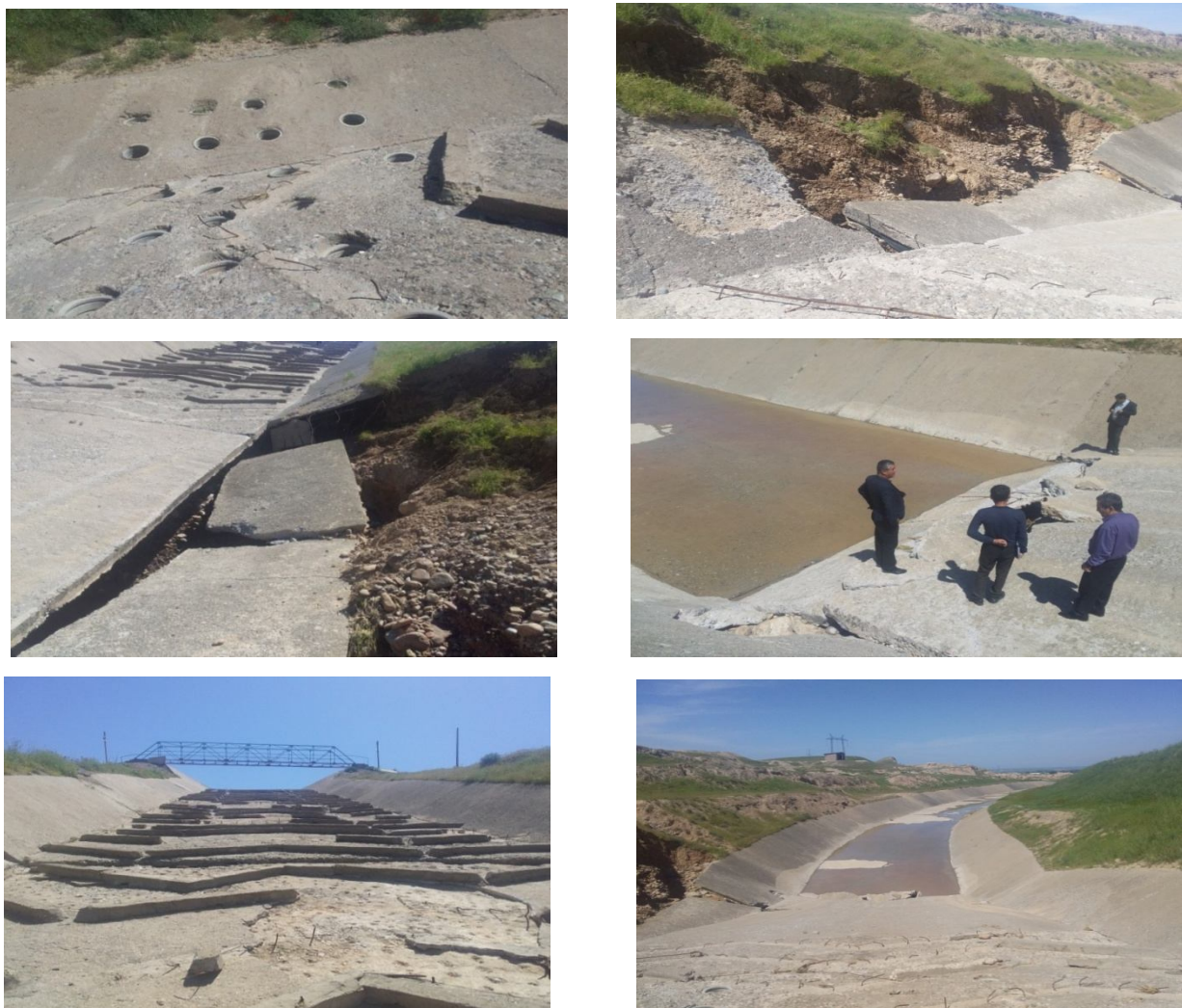
2-rasm. Langar selsuv omborining suv tashlama inshootini sel oqimining kelishi oqibatida shikastlanishlari

Langar selsuv omborining suv tashlama inshootining sel oqimining kelishi oqibatida shikastlanishlari 2-rasmda keltirilgan.