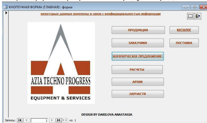
Рисунок 1. Программный продукт, внедренный на предприятие ООО «AZIA TECHNO PROGRESS»

Поэтому для компании ООО «AZIA TECHNO PROGRESS» был разработан и внедрен программный продукт, позволяющий отфильтровать данные и произвести правильный подбор оборудования и запасных частей для заказчиков (интерфейс программного продукта представлен на рис. 1.).