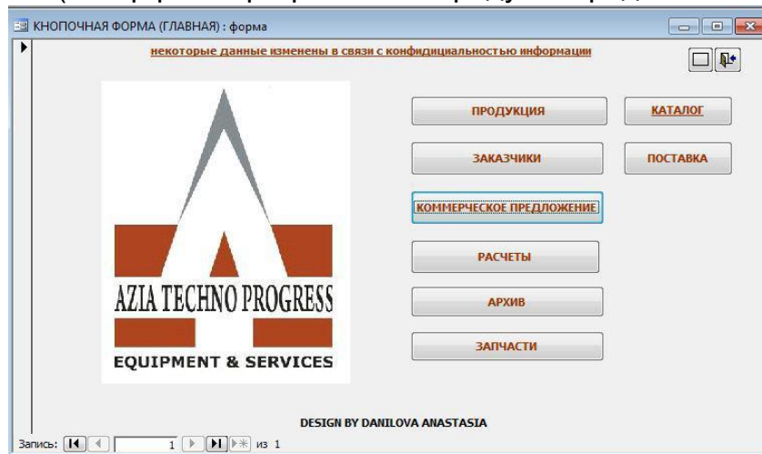
Рисунок 1. Программный продукт, внедренный на предприятие ООО «AZIA TECHNO PROGRESS»

Поэтому для компании ООО «AZIA TECHNO PROGRESS» был разработан и внедрен программный продукт, позволяющий отфильтровать данные и произвести правильный подбор оборудования и запасных частей для заказчиков (интерфейс программного продукта представлен на рис. 1.).