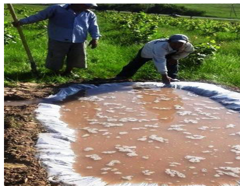
Рисунок 3. Сбор местных сточных вод.

При выращивании виноградников из горных районов в первом случае является то, что вода, используемая для последующих борозд, будет подвергаться последующим бороздам. В результате процесса из-за дождя смывается с поверхности почвы частицы, тяжелые капли дождя падают почти силой, наклон почвы частей посыпаются на мелкие частицы, посыпаются примерно в то же время из-за наклона и сильного потока воды, частицы почвы расплавляются в пыли, мутное водопроницаемое состояние.