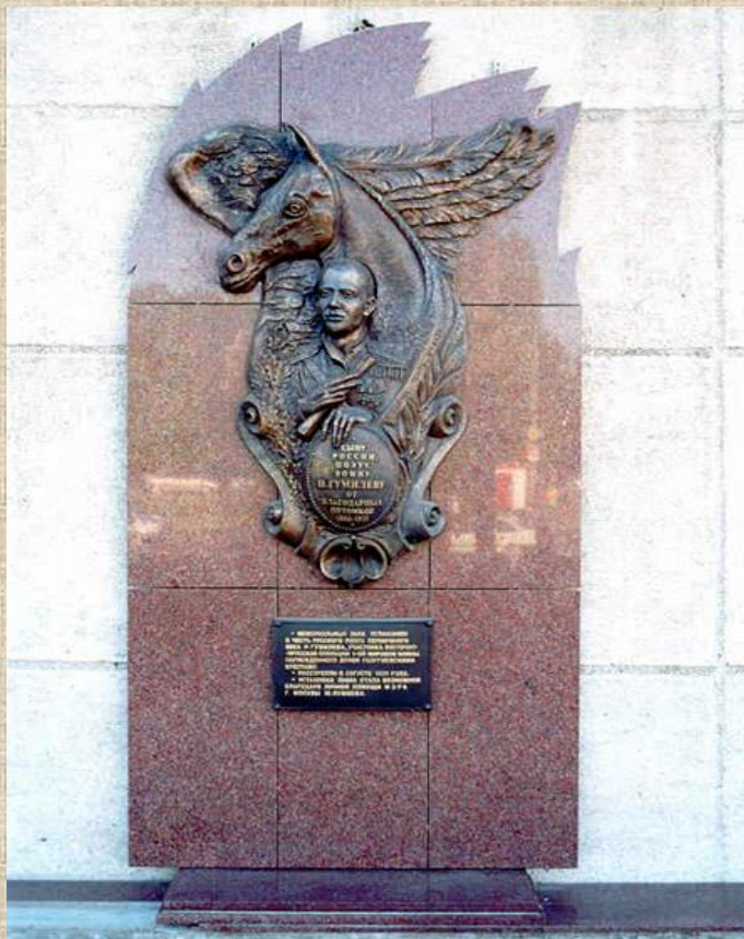
Мемориальная доска в Калининграде