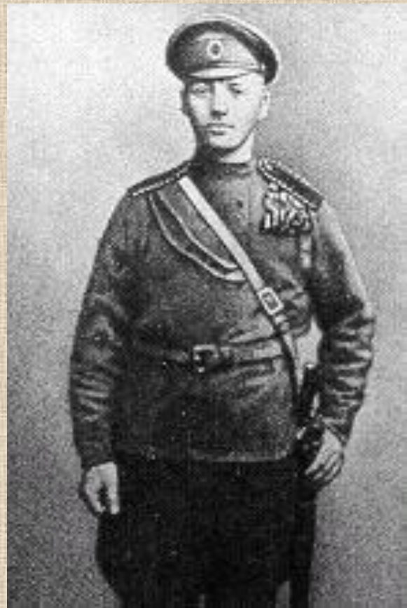
Н. Гумилёв 1914 год

Гумилев был единственным русским писателем, который пошел добровольцем на фронт. Как и ко всему, что делал, к своему участию в войне Гумилёв отнёсся крайне серьезно. Тут же стал тренироваться, совершенствоваться в стрельбе, езде и фехтовании. Служил Гумилёв прилежно, отличался храбростью – о том говорит и быстрое его продвижение до прапорщика, и два Георгиевских креста – IV и III степеней, которые давались за исключительное мужество.