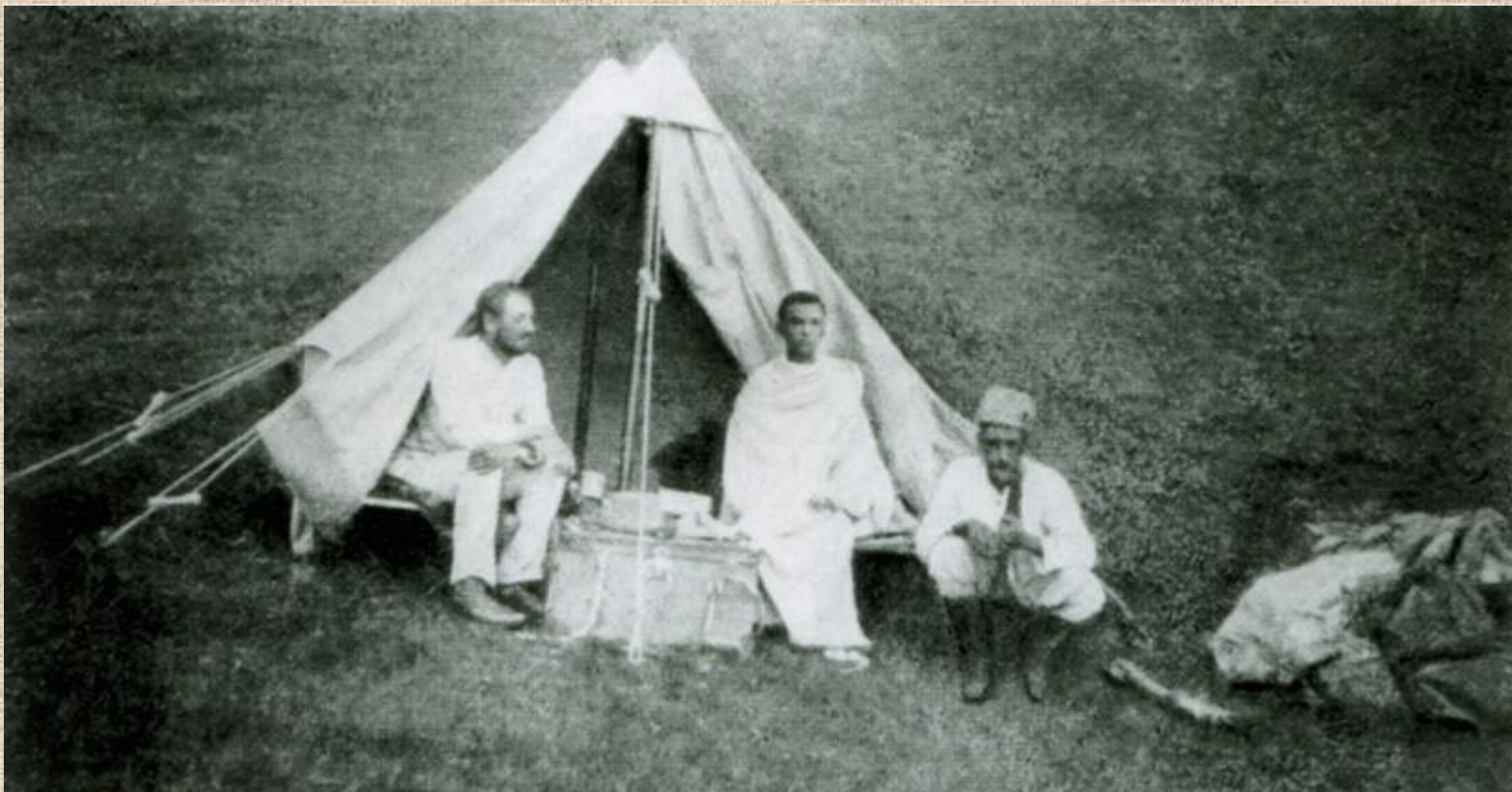
Н. Гумилев в экспедиции в Африке.

Он написал «Африканский дневник», где рассказывал о жизни местных племён, об их легендах и поверьях, о тех приключениях, которые ему довелось испытать во время путешествия.