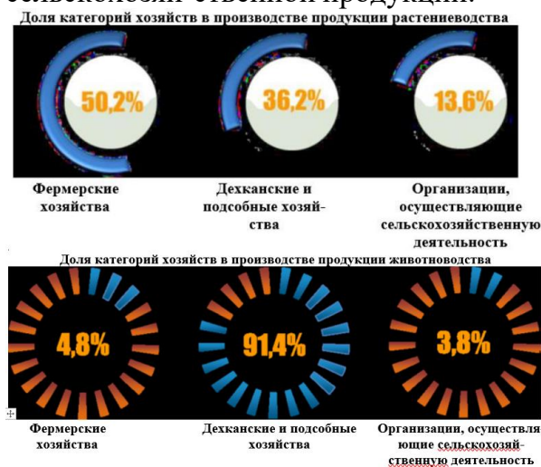
рис.1. Структура показателей сельскохозяйственного производства по категориям хозяйств

В настоящее время среди всего разнообразия форм хозяйствующих субъектов одной из эффективных форм производства являются дехканские хозяйства. Они вносят существенный вклад в сохранение сельского образа жизни и производство сельскохозяйственной продукции.