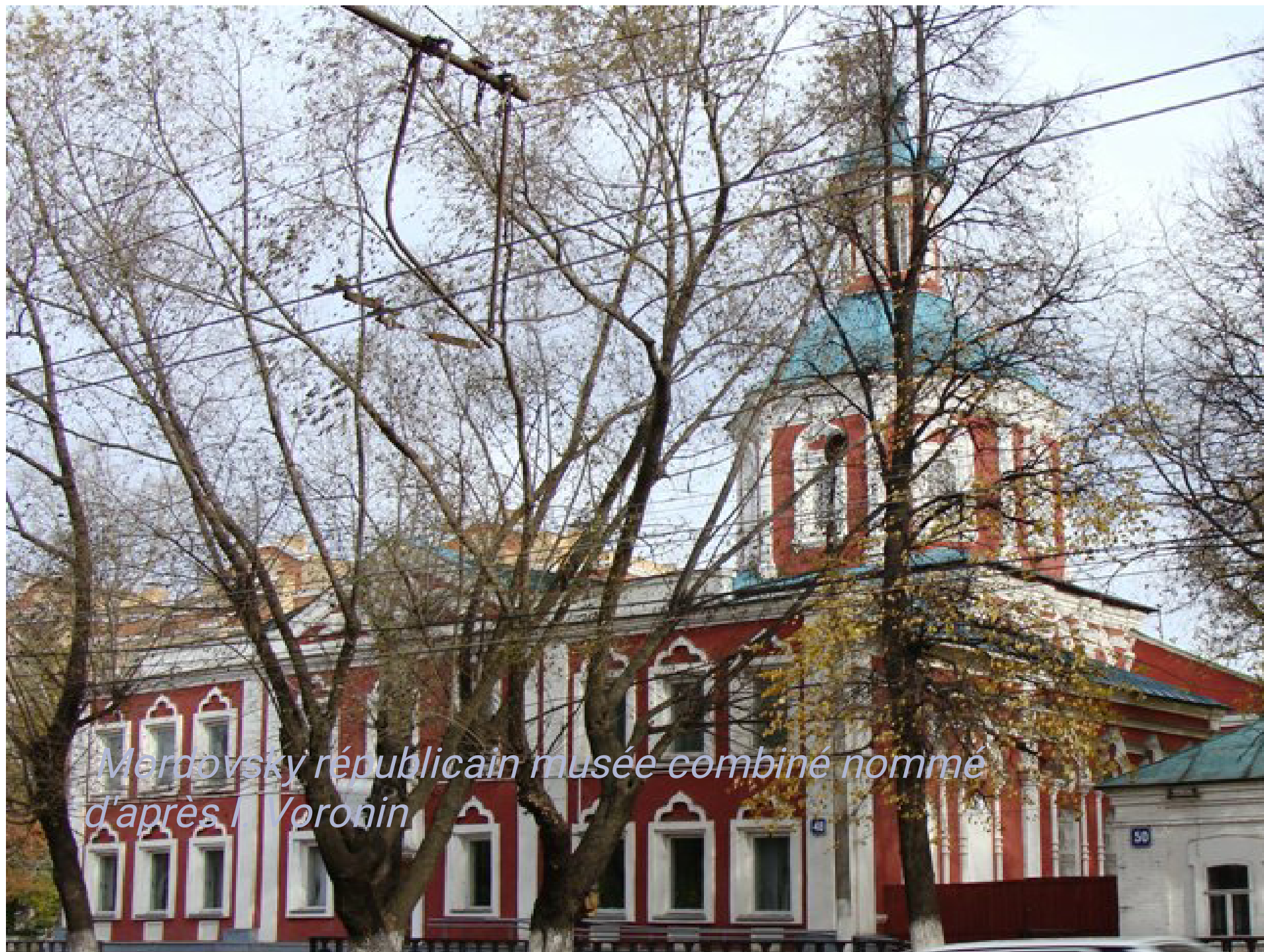
Merdovsky républicain musée combiné nommé d'après I. Voronin