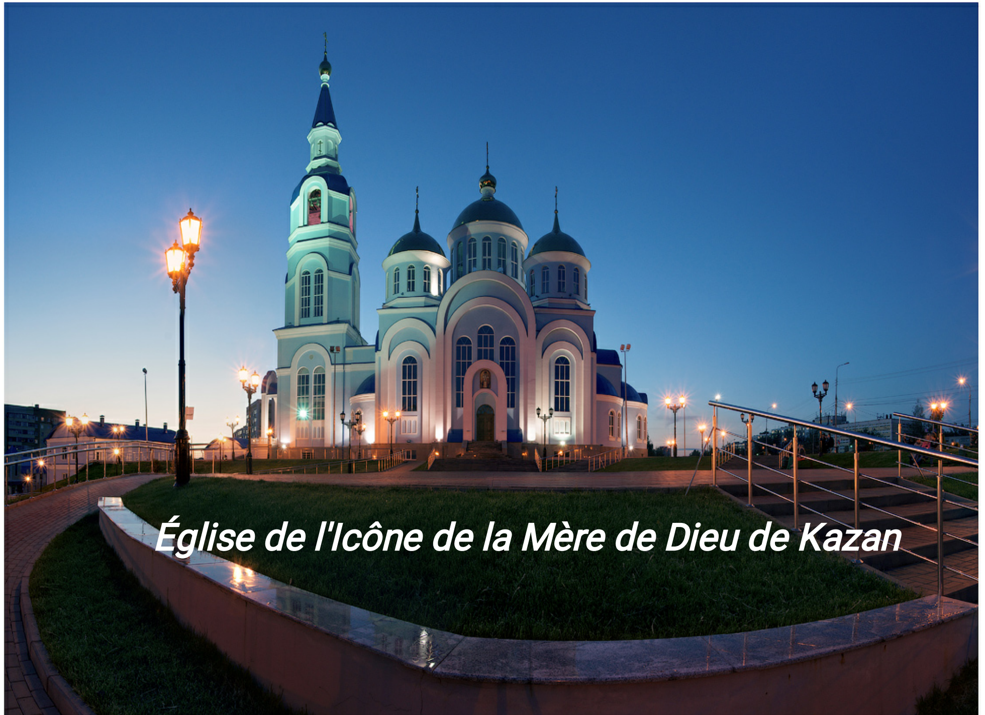
Église de l'icône de la Mère de Dieu de Kazan